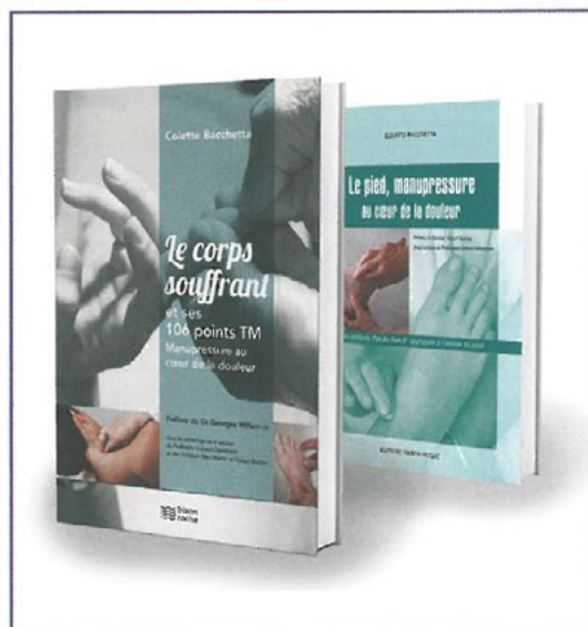
Livre de la méthode Pyé-ko-kan

Les MTM véhiculent l'énergie défensive Wei ou Oé (Qi protecteur). Cette énergie circule à la périphérie du corps, hors méridiens, sous la peau, entre les muscles, dans